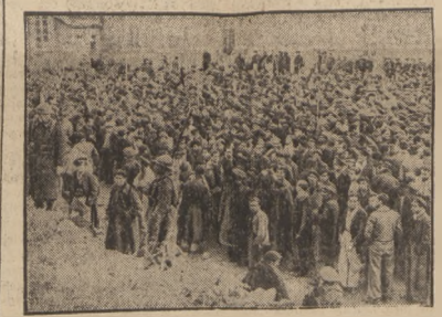
DZIESIĄTKI TYŚCIEC UCHODZCOW HISZPAŃSKICH NA GRANICY FRANCUSKIEJ

stanu w min. spr. zagr. Termin powrotu wysłannika francuskiego do Paryża nie jest jeszcze ustalony. (PAT).