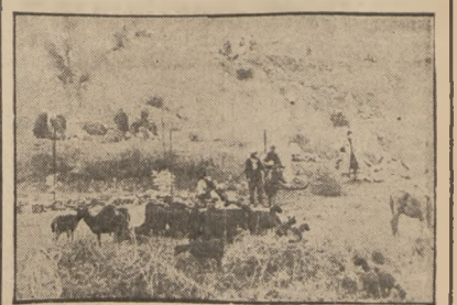
Ludność hiszpańska na pograniczu w Pirenejach ucieka do Francji wraz ze swymi stadami bydła.