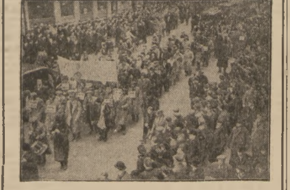
Po wielkich demonstracjach bezrobotnych w Londynie odbyły się z kolei wielkie demonstracje farmerów przeciw polityce Rządu Chamberlaina. Nieśli oni transparenty z napisami: „Ratujcie rolnictwo angielskie!”.