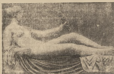
JEDNO Z ARCYDZIEŁ A. MAILLOL

Od genialnego Rodina do młodego pokolenia mistrzów francuskich