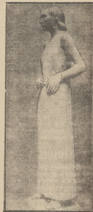
RZEZBA W MUZEUM