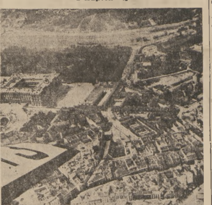
OGÓLNY WIDOK MADRYTU

Agencia Havasa donosi, iż pomiędzy Rządem Hiszpanii gen. Franco a juntą madrycką został nawiązany kontakt z inicjatywą madryckiego komitetu obrony narodowej. W Madrycie są rzekomo już znane warunki Rządu gen. Franco. Od odpowiedzi, jakiej udzieli komitet obrony zależy czy dojdzie do porozumienia. Wojaka gen. Franco mają obrazy podległe Rządowi madryckiemu bez walki albo w razie nie dojdzie do porozumienia rozpocznie ofensywę. W kolach zbliżonych do gen. Franco, według agencji Havasa, podkreślają: 1) Rząd w Burgos nie uczynił ze swej strony nic, by spotkać się z przedstawicielami swych przeciwników; 2) Zważywszy, iż wszystko jest