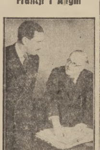
Ministrowie lotnicstwa Francji i Anglii uzgodnili plany obrony powietrznej obu państw w razie wybuchu wojny.