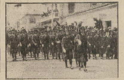
UZUROJONE ODDZIAŁY ALBAŃSKIE NA ULICACH TIRANY PRZED WYKROCZENIEM WÓJSKA WŁOSKIECH.

nie jest pijakiem, to czym pan w ogóle jest! Na natarczywe dobieganie się prosiłoby do przytulki dla nieuczciwych, w których nieuczciwosci, szlachony już na dobre odzwierzytelnił go do wszystkich diabłów. Prosiłoby nie pozostało nieś. Niech jak udać się do dyrektora zakładu, na którego telefonicznej interwencji odzwierzytelnił go do otworzył drzwi zakładu.