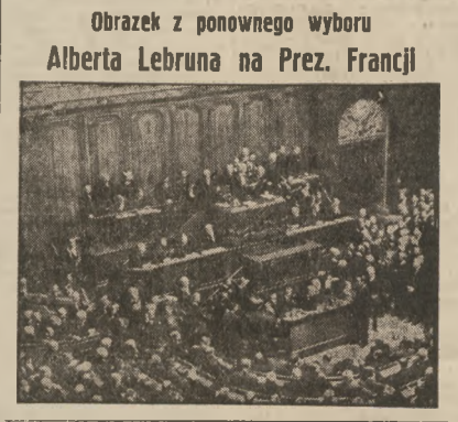
Obrazek z ponownego wyboru Alberta Lebruna na Prez. Francji

Klimat, fauna i flora na wybrzeżu mają charakter śródziemnomorski, w głębi kraju, w rejonie górskim, przelazie podlegają drzewom liściastym, charakter śródziemnoeuropejski, w większej części rosną zieleń. Na wybrzeżu rosą liczne gatunki oliwek. Stoki gór były do niedawna pokryte bogatymi lasami liściastymi i świerkowymi, które, począwszy od wielkiej wojny, zostały przeważnie rabunkowo gołopodarką w dużej części zniszczone. Bogactwa ziemne są tu dopiero jeszcze nie zbadane. Eksploatuje się sól na wybrzeżu oraz porfiry i azfali w Selenicy pod Waloną. Są czynione poszukiwania ropy i ten fakt zwrócił uwagę wielu zainteresowanych.