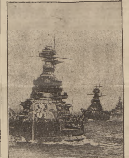
POTĘŻNE ESKADRY FLOTY ANGIELSKIEJ NA MORZU ŚRODZIEMNYM. NA PIERWSZYM PŁA NIE NAJPOTĘŻNIEJSZY PAN-CERNIK ŚWIATA „HOOD”.

Wojska chińskie o 15 km. od Kantonu Według relacji ze źródeł chińskich, przednie strażnice armii chińskiej, operującej na odcinku kantoniskim, znajdują się zaledwie 15 km. od Kantonu. Wojska japońskie na tym odcinku w zupełnym odwrocie. Linia kolejowa Kanton — Kaolan znajduje się całkowicie w rękach chińskich. W ostatnich dniach wojska chińskie zdobyły ponad 500 maszyn i miejscowości z kilkumilionową ludnością. Na odcinku Tientsin dowodzący wojsk japońskich przygotowuje się do kontrofensywy.