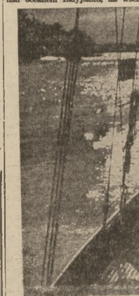
LEGENDY O „GÓRZE MAGNESOWEJ”