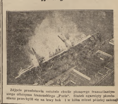
Zdjęcie przedstawia ostatnie chwile płonącego transatlantycznego olbrzyma francuskiego „Paris”. Stalki ogniarzy pomie-nianu przebiegły się na lewy bok i w kilka minut później zatonęły.