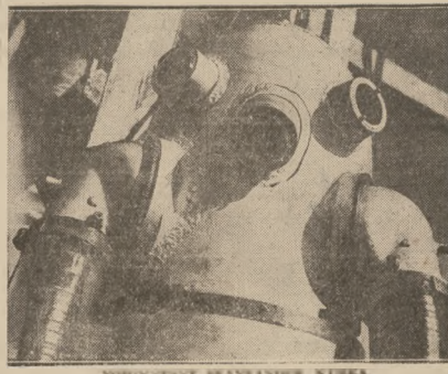
INNOVACIJSKI BRANJANER STUBBA