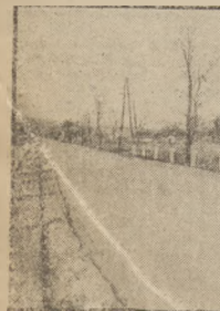
DROGA BETONOWA NA TRASIE CIESZYN — BIELSKO

„Droga Lincoln — San Francisco 3.384 mil”. Długość tej szosy wynosi zatem w przybliżeniu 5.955 kilometrów. Na całej trasie liczy się na 20 metrów szerokości i przecina terytoria dwunastu stanów.