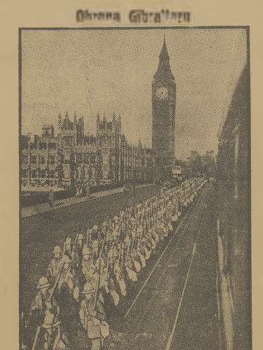
WOJSKA ANGIELSKIE WYRUSZAJĄ Z LONDynu DLA WZMOCNIENIA ZAŁÓG GIBRALTARU