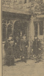
GEN. WEYGAND W LONDYNIE

Rola Hiszpanii gen. Franco w przyszłej wojnie Ostatnio w rozważaniach fachowców zarówno we Włoszech, jak i w Niemczech wyłania się na plan pierwszy pogląd, że „osiągnięcie błyskawicznego rozstrzygnięcia jest decydującym czynnikiem sukcesu militarnego państw „osi“. W tym kierunku w czasie ostatniej wizyty Brauchitscha we Włoszech ustalono szczegółowy plan działania i podzielił na poszczególne odcinki przyszłego frontu wojennego. Pierwszy atak „osi“ nastąpić ma na odcinku śródziemnomorskim w punktach szczególnie ważnych dla Francji i Anglii. Dla realizacji tych zamierzeń konieczne jest współdziałanie Hiszpanii z państwami „osi“. W tym kierunku kład wysiłki dyplomacji włoskiej. Akcja ta prowadzona jest jednak z nadzwyczajną ostrożnością, aby przez przed-