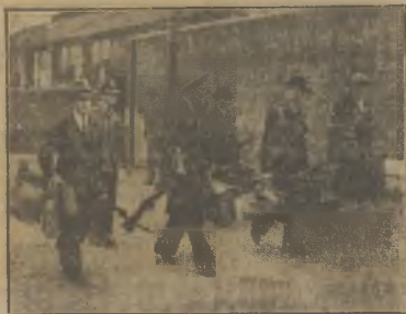
Nasze zdjęcie przedstawia jeden z pierwszych oddziałów z powszechnego poboru w Anglii.

Czechy budzą się z odrętwienia. Ludność przyzwyczaiła się do terroru i odpiera, jak może, Niemcom płkny w załobne. Nieważnie i złość wzięły górę nad bojaźnią. Niemcy, że niezłego dobrego od swoich „profektatorów” spodziewać się nie mogą, że żadne obietnice nie będą dotrzymane. Obiecano Czechom równouprawienie. W praktyce równouprawienie wygłada tak, że Niemcy wydają rozporządzenia i rozkazy, a Czechy muszą je wykonywać; zanika się szkoły czeskie, a otwiera niemieckie, złączaszczawoło się prasa, demobilizuje się armie czeskie i wyrzuca na bruk niewygodnych urzędników i oficerów.