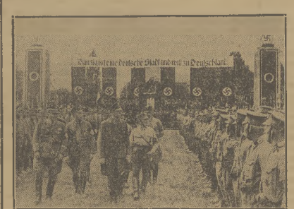
Narzucony „Wolnemu” Miastu przez Hitlera p. Albert Forster przyjmując parady hitlerowskich szturmówek w Gdańsku. Parada ma na podnieść na duchu przegranych kłaskami na wszystkich frontach, hitlerowców.