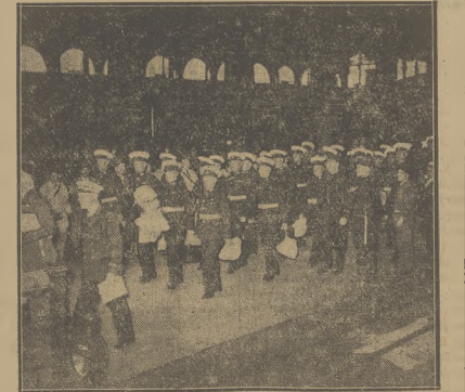
Brytyjscy marynarze na dworcu w Paryżu. Oddziały brytyjskie— jak wiadomo — przybyły, aby wziąć udział w deflady wojsk fran- cuskich i angielskich w dniu Święta Narodowego Francji.