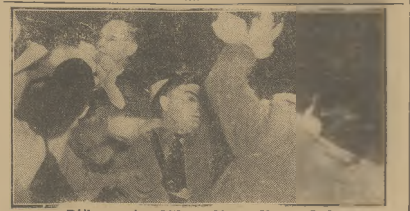
Bójka na wlecn hitlerowskim w Nowym Jorku.

W Bułgarii W Bułgarii Niemcy posiadają kilka organizacji kulturalnych, których działalność koncentruje się w Sofii. Istnieją tam, obok kilku szkół powszechnych, pod nazwą biblioteka i klub, skupiające nieliczną zresztą w starości Bułgarii, element niemiecki. Wychodzi też kilka pism w języku niemieckim. W Związku Niemieckim mamy jedno pismo „Türkische Post”, wychodzące w Istanbulu. Istnieją tam też duża biblioteka, starożytna miejscę spotkań niemieckiego elementu niemieckiego.