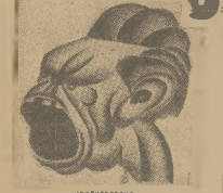
HERSZT PROPAGANDY RZESZY

Wszystkie jego obserwacje, wszelkie cyfry mogą być spisane jedynie w pamięci, a dopiero przy spotkaniu na neutralnym gruncie przekazane osobie drugiej. Do ćwiczeń tych „profesorów” posługują się często różnymi filmami kryminalno - szpiegowskimi. „Szuchacz” stara się pamiętać wszelkie szczegóły i drobiazgi akcji, wygląd bohaterów, po czym po pewnym czasie poddany będzie badaniom, weryfikującym jego spostrzegawczość i pamięć. W dalszym ciągu zapoznaje się w tej szkole z różnymi sposobami i rodzajami szpiegów. To galeń wiedzy należy przeżyć szczególnie starannie, albowiem szpyszy są stale zmieniane, przyszły więc „agent specjalny” winien je jaknajlepiej poznać. Ostatni wreszcie etap, to zapoznanie słuchacza z całokształtem zagadnień wojskowych, gospodarczych, społecznych itp. Miał się on doskonale orientować zarówno w najnowszych wynalazkach z dziedziny wojskowej, jak i w szeregu stłompiakowanych zagadnień ekonomicznych. Jak widać z powyższego, drogę, prowadzącą do przyszłej „karriery” w służbie wywiadowej nie jest tak prosta. „Szuchaczom” stawia się duże wymagania. Po zakończeniu egzaminu zostaje on