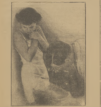
Pomysł szpiegow — szpyszy zanoł w tym atamentem zanikającym na udach dzelazownicy. Po przejęciu prz granicę szpyszy zostaje wywołany.

Ameryka jest daleka od ewentualnego „terenu wojny”, od Europy, ale prasa amerykańska coraz więcej miejsca poświęca niebezpieczeństwom hitlerowskim. Władze amerykańskie mają także