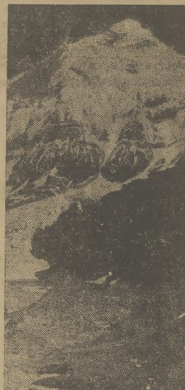
SZCZYT NANDA-DEWI W HIMALAJACH, GDZIE WYBUCHAŁA SIĘ KATASTROFA.