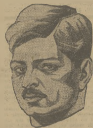
KRÓL KAROL RUMUŃSKI.

Dziennik przewidywa MOŻLIWOSC KONFERENCJI KRÓLA KAROLA, KRÓLA BORYSA, KRÓLA GRECJI JERZEGO I PREZYDENTA TURCJI INONU. Konferencja ta miałaby na celu ustalenie sytuacji Bułgarii w porównaniu z Grecją.