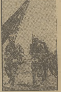
W następstwie incydentów na granicy bułgarsko-tureckiej skoncentrowano na granicy wojska obu stron. Na zdjęciu oddział turecki idący się w kierunku granicy.

szalka również w swym biuletynie w języku niemieckim, przeznaczonym specjalnie na Niemcy. Berliński „Montag Post” podaje komunikat D.N.B. o święcie krakowskim, zapominając go o obrazliwym tytule. Pomimo że wiadomość została podana na naczelnym miejscu serwisu politycznego, w treści widoczna jest tendencja do zbagatelizowania przemówienia marszałka Śmigłego-Rydzia. Pismo staje na stanowisku, że „Marszałek na nowo przedstawił dostatecznie znany polski punkt widzenia w sprawie Gdańska”. Wiadomość o nowej nocie Polski do senatu gdańskiego została przemilczana przez prasę niemiecką.