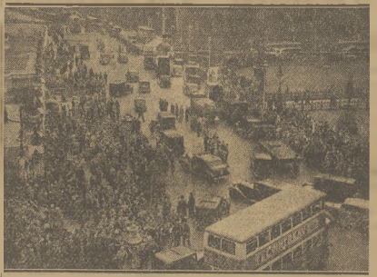
TLUMY ZBIERAJĄ SIĘ PRZED ANGLIJSKĄ IZBĄ GMIN W LONDYNIE W OCZEKIWIANIU NA WIADOMOŚCI