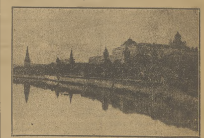
Na Czerwonym Kremlu odbywają się obecnie obrady Najwyższej Rady ZSSR w związku z sowietem niemieckim paktem o nieczł.