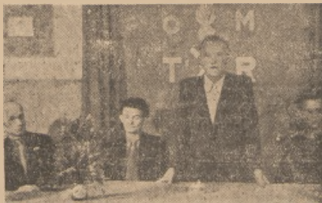
Dnia 7 bm. odbył się Powiatowy Zjazd OM TUR, na którym były omawiane ważne sprawy organizacyjne. — Na zdjęciu prezydium zebrania.

To nowe supadnie podjęcie do socjalizmu i kształcenia Cadwicka — Socjalizmu doprowadziło do bardziej jeszcze ożywionej wymiany zdań. Dyskusja została przerwona do zebrania następnego. (B. G.)