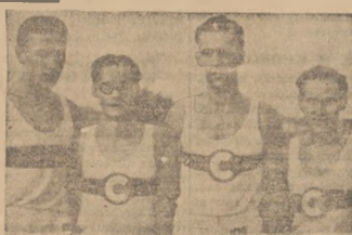
W sobotę i niedzielę odbyły się zawody lekkoatletyczne o mistrzostwo polski. Na zdjęciu stałofa 4x400 m, która przechyla szalę zwycięstwa na korzyść Cracovii.