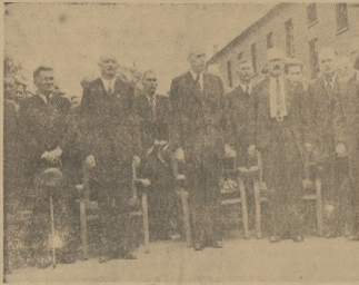
MUZEUW W „OBOZIE ŚMIERCI”

WARSZAWA. — Czwartkowy wieczór w Sejmie. W sali sejmowej Prezydium i podłazie