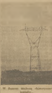
W dymie mroźnym zimnym powietrzu.

O zbyty Willis dźwięnią gesty kropie. Na horyzoncie zdów pojawiają się kominys Śląska i Łódz-