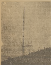
Reżim konstrukcja stali i betonu

częściej pojawiają się żółta plama płaszczyzny wydm i ugory utracone — pustynia — wściekłość.