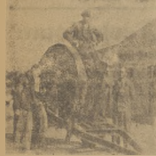
Pracownik — mowa sily elektrycznej przed rozdzieleniem na masztach

U nas budowa takiej linii o napięciu na 2 — powiedniał jeden z inżynierów francu-