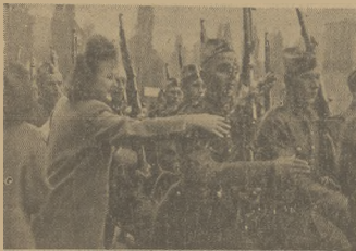
RCHA ŚWIĘTA ODOBODZENIA