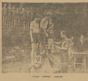
„madził się sklerowicy obozu...

DESZCZ — WRÓG Nr 1 Nad wieżami do obozu... słusko, jak samo, jak dawać napis, Wilmy. I obóz taki