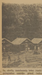
Na obywateli wzięcia tego roku...

(A) Wszelkie osoby podlegające porzeczemu obywatelstwu wojakowemu obywatelstwo w prochuajni mieściska wzięcia tego roku kalendarzowego, w którym ukończyli lub ukończą 15-ty rok życia, sągodni, są obywateli do rejestru poborowych. W związku z tym, na podstawie § 61 ust. (1) rozporządzenia z dnia 7. 2. 1930 — wyznacza się wszystkich męzczyzn urodzonych w roku 1930, zamieszkałych na terenie miast: Krakowa — 15 8, Bz-G — 18 9, F-R — 17 6, S-Step — 18 9, Star-Se — 19 8, Y-W — 20 9, Z — 23 8. Męzczyzn, którzy z ważnych przyczyn nie będą mogli zgłosić się do rejestracji w podanych terminach, obowiązani są zgłosić się przed władzami urzędunkowymi do rejestracji poborowych, w terminach podanych w obwieszczeniu. Przy zgłoszeniu należy przedłożyć dokumenty, jak dowód osobisty, metrykę urodzenia, świadectwo szkolne. Osoby, które nie zgłoszą się do rejestracji poborowych będą karane w myśl art. 376 z uwagiedzeniem przepisu dotyczącego art. 11, § 4, grzywną do 20.000 zł lub arestem do 200 dni, z 2 miesięcy, albo obu tymi karami łącznie.