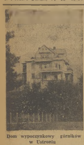
Dom wypoczynkowy górników w Ostrowie