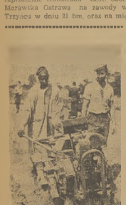
Czelechi delegacji polskiej w Gódku (Zachodni) przybyli do Londynu w celu zapoznania się z organizacją międzynarodowych projektów motocyklistów z „Bydgoski” i „Traktores” (Polski) w Bydgoszczy i „Hafslod” w Szwecji.

KATOWICE — Na ostatnim zebraniu Zarządu PZM okręgu śląskiego postanowiono przyjąć zaproszenie Autoklubu CSR, oddu Motorowa Ostrowy, na zawody w Trzyczynie w dniu 31 bm, oraz na miasto.