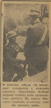
W Gdańsku odbyła się uroczystość poświęcenia i wręczenia sztandaru Gdańskiemu Pułkowi Artylerii Lekkiej przez społeczeństwo gdańskie. Na zdjęciu Marszałek Związku Pracowniczy szan. dr. dowódca pułku.

Przywódca demokracji amerykańskiej piętnuje podżegaczy wojennych