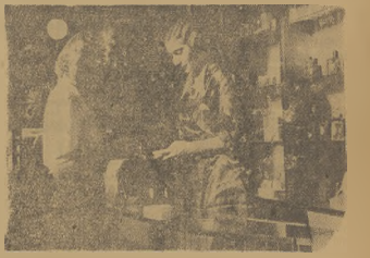
Dnia 27. 9. 47 r. został otwarty Dom Handlowy „Społem” przy ulicy Ma... (tekst nieczytelny)

BERLIN — Amerykańskie wojska okupacyjne podjęły do wiadomości, że wkrótce zmierzono zniszczenia podziemne zakłady budowlane smolodów Messersmitha w Augsburgu oraz szereg innych zakładów przemysłowych, znajdujących się pod ziemią.