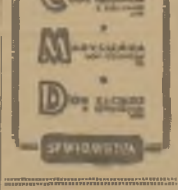
Waga studentów absolwentów ZNMS-ducy!