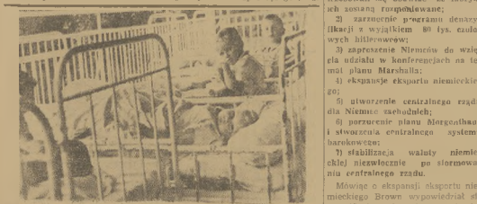
Wielkie dzieło odzyskańi zdrowia przy pomocy regionalnego leczenia szlarynowo-klimatycznego. Na zdjęciu mial pacjenci zakładu Ubezpie-