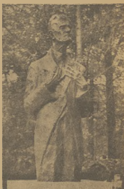
Pomnik-grobowiec tow. I. Daszyń- skiego ufundowany ze środków ro- botników - Pepesowców w dowód czci dla Wielkiego Trybuna Ludu Polskiego