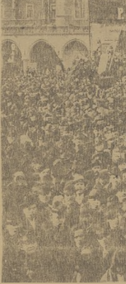
Tow. Ignacy Daszyński walcząca o nowsze prawo wyborcze...

"Pracowałem całą życie z robotnikami. Im zawdzięczam, że praca moja nie poszła na marne..."