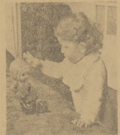
Polakie zabawki zdobywały sobie zaczynienie rynku zbytku. Produkcja lelek itp. jest ograniczona z powodu braku surowca podstawowego, jakim jest celuloza.