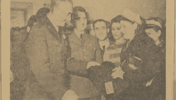
Dyrektor Biokęki z ramienia Rady Poloni przekazał Bratelanom Uniwersytecki i Politechniki Warszawskiej 388 kosztów miejskich, 150 kosztów i 150 złotych.

LONDYN — Ostatni w tym mecz na terenie Anglii rozegrany wzajemny zwedkowy drużyny hokejowej AIK z Sztokholmu z reprezentacją Anglii. Spotkanie zakończyło się wynikiem nierozstrzygniętym w stosunku 3:3 (1-2, 2-0, 0-1). Jest to zarazem jedyne mecz drużyny szwedzkiej podczas turnieju w Anglii, który nie przyniósł jej porażki.