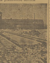
Brama śmierci w Brzezynie. Tędy uleciały ostatnie dwaga milionów ofiar do komór gazy, krematoriów i dobow spaleniowych. Ostatni przyjazd, omeły przy transportu do szpitali. Niechętne i tym młodym matką omeły.

publizacji. Jako drugi wzmiankowany zabiera głos ok. Masłowski, lekarz obrotowy, który miał pytać pod adresem świadka wygłasza dalsze przemówienie obrzędca.