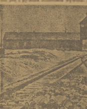
Brama śmierci w Brzezynie. Tędy uleciały ostatnie dwaga milionów ofiar do komór gazy, krematoriów i dobow spaleniowych. Ostatni przyjazd, omeły przy transportu do szpitali. Niechętne i tym młodym matką omeły.