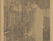
Tu odbywa się egzamin powiatowy kołpańskiego, szarypanie widać dla kopala gorniczych.

W tle słychać dźwięki kłosałki, która służy do wybijania kamienia z wyrobiska. W tle słychać dźwięki kłosałki, która służy do wybijania kamienia z wyrobiska.