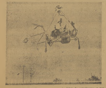
Wzrost modelu samolotu wojennego przez armię USA do współpracy z 300- tonową ułaską B-29 Superfortress.

Oskarżony Steinhilber został skazany na 5 lat więzienia. Wice - na 2 lata Oskarżeni Kautels, Forberger i Buechhans zostali uniewinni-