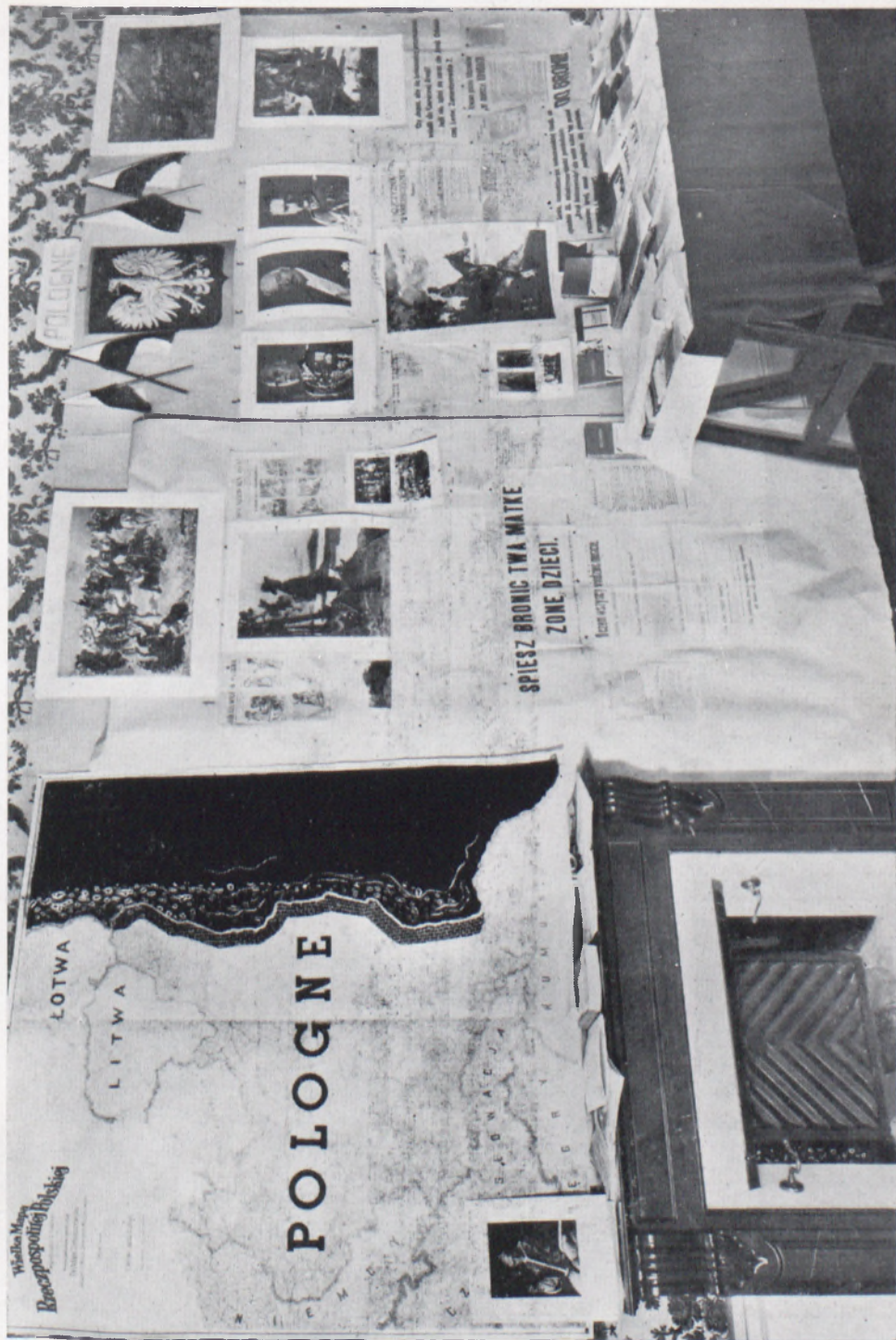
Fragment głównego stoiska polskiego na międzynarodowej wystawie antykomunistycznej w Genewie w 1939 r.