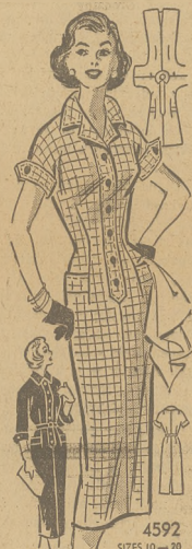
Sheath fason w krótkim wykonczeniu.

Przy zamówieniu modelki PODAĆ WYRAŹNIE NAZWISKO I ADRES oraz NUMER I ROZMIAR MODELKA uży-