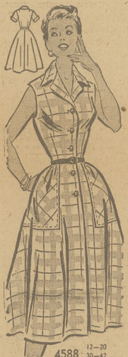
Shirtwaist fason z rękawami lub bez.

Nr. 4588 przychodzi w rozmiarach 12, 14, 16, 18, 20, 30, 32, 34, 36, 38, 40 i 42.