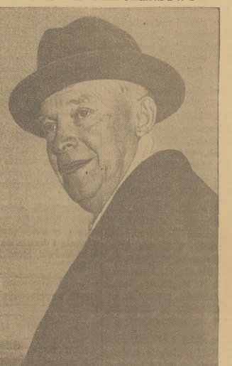
Prezydent Eisenhower opuszcza Narodowy Kościół Prezbiteriański w Washingtonie, po uroczystym nabożeństwie inauguracyjnym dla członków Kongresu.