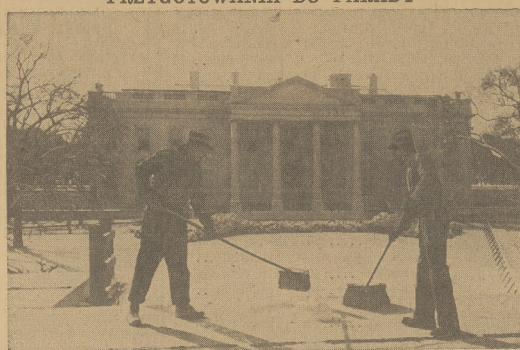
W związku z przygotowaniem do parady inauguracyjnej Prezydenta, która będzie miała miejsce w nadchodzący poniedziałek, robotnicy usuwają śnieg przed frontem Białego Domu.