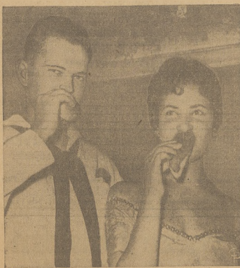
Marynarz amerykański, stacjonujący w Tel Aviv, poznaje miejscową piękność z amerykańskim przymakiem — parawkami.