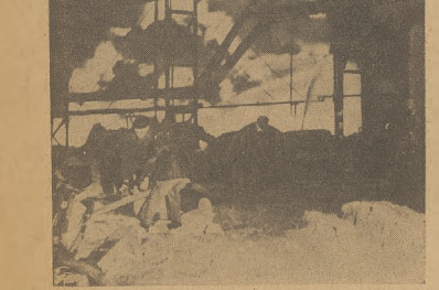
W rafinerii Standard Oil Co., w Whitin, Ind., powstał pożar, którego ślady były w widzeniu w promieniu dziesiątek mil. Wysoko oktanowe paliwo wzmagało płomienie