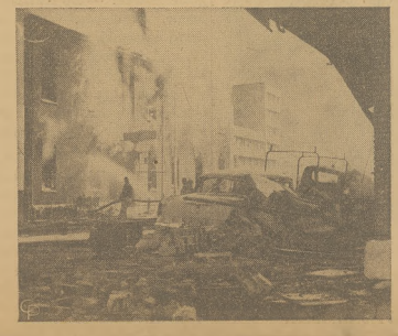
Pożar, który zniszczył dwa bloki, widziany z lotu ptaka. Ruiny domów zniszczonych eksplozją i pożarem. Dwie osoby zginęły, przeszło 50 zostało rannych.