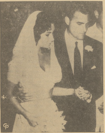
W miejscowości Acapulco w Meksyku odbył się ślub znanej gwiazdy filmowej Elizabeth Taylor z producentem Mike Todd.