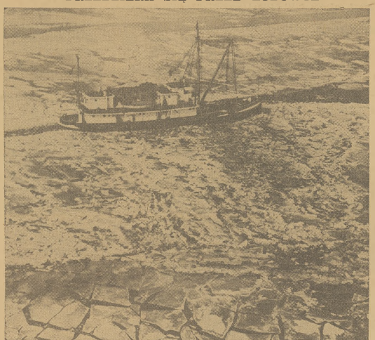
Posuwając się drogą utartą przez dwa holowniki Straży Przybrzeżnej okręt ładunkowy przedziiera się przez pokrytą lodem zatokę Chesapeake, Maryland.