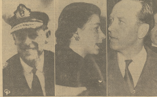
W pałacu Buckingham zaprzeczono pogłoski o dysonansie między parą królewską. Królowa Elżbieta (w centrum) i jej małżonek nie rezygnacji sekretarza ks. Edinburga, por-komandora z żoną.