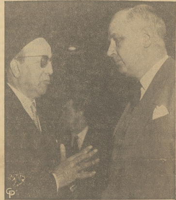
Również w sprawie algierskiej konferował przed sesją Org. Nar. Zjedn. francuski minister Spraw Zagranicznych Pinau z vice-prezydentem Algieru Ali Chekkal.