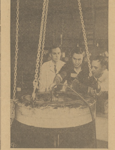
Naukowcy z firmy B. F. Goodrich w Idaho uczynili próbę wulkanizowania opon samochodowych przy użyciu energii atomowej zamiast zwykłego gorąca.