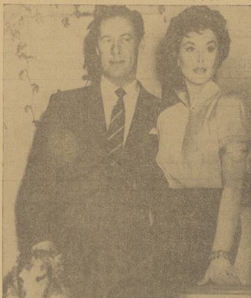
Aktor brytyjski Rex Harrison w czasie przyjęcia w Hollywood...