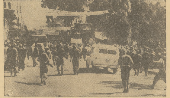
Tłumy arabskie usiłowały wdrzeć się do głównej kwatery Narod. Zjedn., w Gazie, od czego powstrzymały je ówskie oddziały wojskowe, używające gazów łzawiących. Akcję tę rząd egipski nazwał "ogniem przeciw ludności Gazy" i zapowiedział natychmiastowe przejście administracji cywilnej.