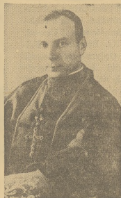
Ks. Kardynał Wyszyński

30 stycznia h.r. uprzejmie donoszę, że nie widzę przeszkód, dla których wycieczka Polaków z Ameryki miałyby