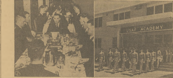
Powyższe zdjęcia przedstawiają kadetów Akademii Lotniczej w Denver, Colorado, gdzie są szkoleni na przyszłych lotników.