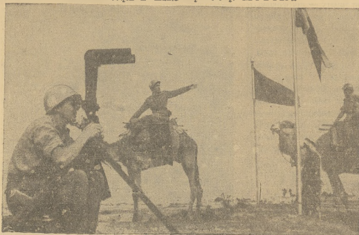
Podczas wycofywania wojsk izraelskich z miejscowości Gaza, formacje szwedzkie, będące częścią wojsk ONZ, używają wielbłądów zamiast pojazdów zmotoryzowanych, przy przejściu przez pustynię Synaj.