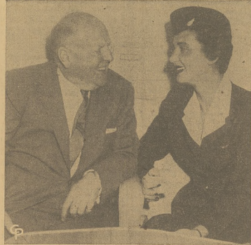
Po inwestycji w Washingtonie, przywódca unii "Teamsters" Dave Beck udaje się do domu, w Seattle, do chorej żony.