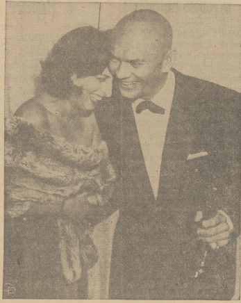
Yul Brynner otrzymał na grodzie Oscar za najlepszą grę aktorską, jaką była jego rola króla sjamskiego w filmie "The King and I".