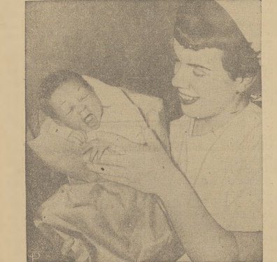
Słow. św. Wincentego w Chicago przycięno do swego sierotnica niemowlę niewiadomego pochodzenia, które z nieznanymi podrozwem w torbie do zakupów puszczę za śmieciami. Malenistwo znalazłone jeszcze żywe, dzięki jego głoszącym krzykom.