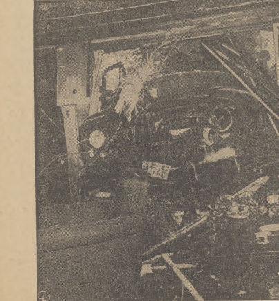
Mieszkaniec Venice, Cal., nie stracił spokoju ducha i nie przerwał rozpoczętego śniadania, gdy dwunastu samochodów ciężarowych rozbili ogromne okno i wjechał do jego bawliani.